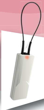
ワイヤー式自鳴タグ IN-M-WI サイズ：70×25×11mm