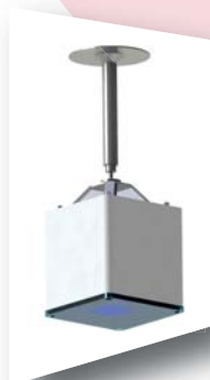
Air-C アンテナL TS-MC-L ※フィクサー別 サイズ：150×150×150mm