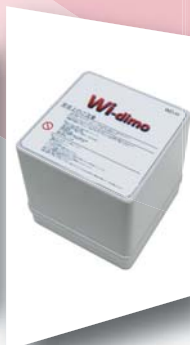
Air-C アンテナS TS-MC-S サイズ：100×100×100mm