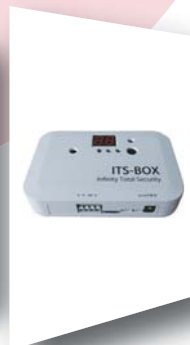
ITSボックス(音検知) ITS-02-B サイズ：150×100×30mm