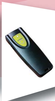
ハンディリセッター IN-M-RST サイズ：105×40×15mm