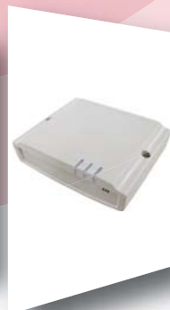
時限解除器 IN-RAT-S サイズ：140×110×38.5mm