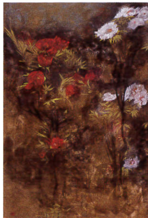
石本正「天王紅白牡丹」 浜田市立石正美術館蔵