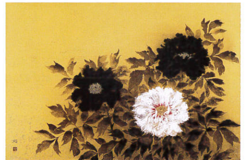
加山又造「牡丹」名都美術館蔵 (展示期間：10/12～11/4)