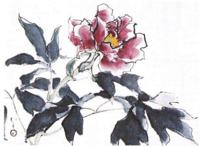
川端龍子「富貴」華鶴大塚美術館蔵