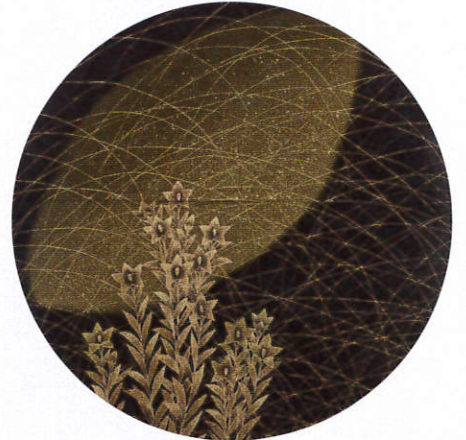
絹縮緬地 月に桔梗 友禅 風呂敷