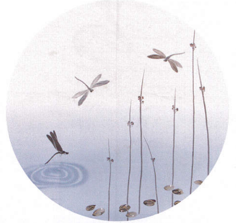
絹紋織地 夏草勝虫紋様 友禅 風呂敷