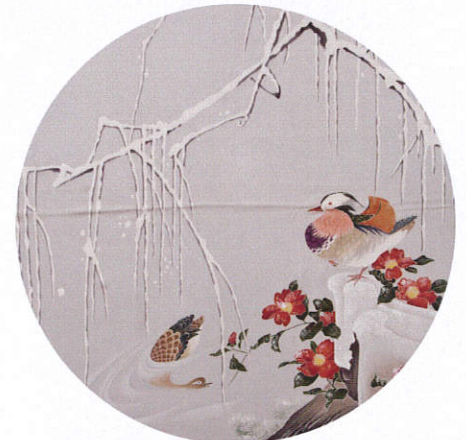
絹縮緬地 雪椿に鶯鶯紋様 友禅 風呂敷